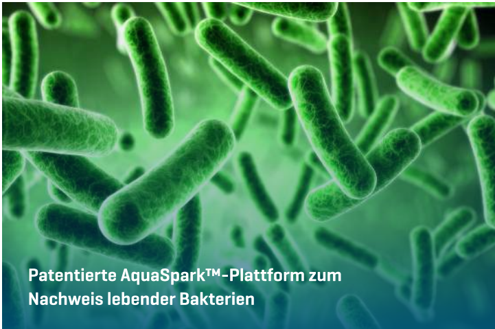
Patentierte AquaSpark™-Plattform zum Nachweis lebender Bakterien

DAS N-LIGHT™ E.COLI-RÖHRCHEN ENTHÄLT EINE EINZIGARTIGE, INNOVATIVE TECHNOLOGIE