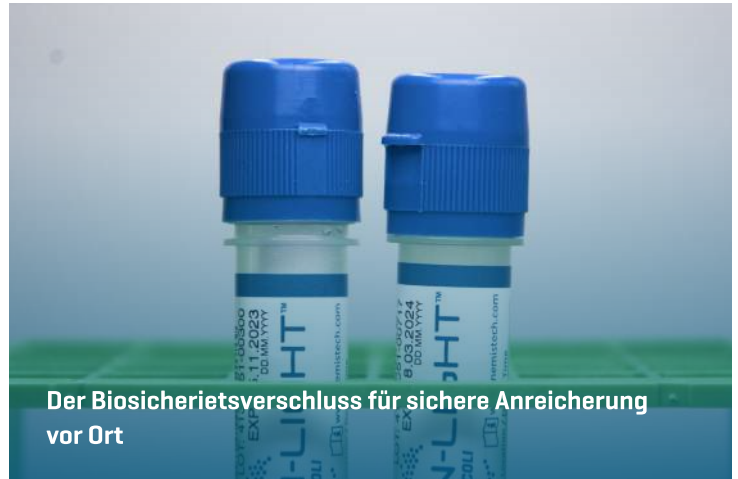
Der Biosicherheitsverschluss für sichere Anreicherung vor Ort